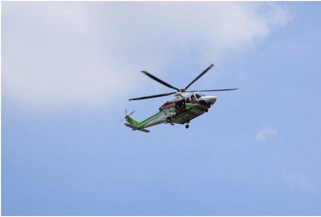
群馬県防災航空隊