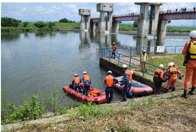
各消防本部舟艇準備