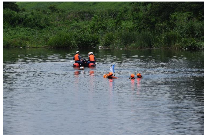
潜水隊の活動の様子