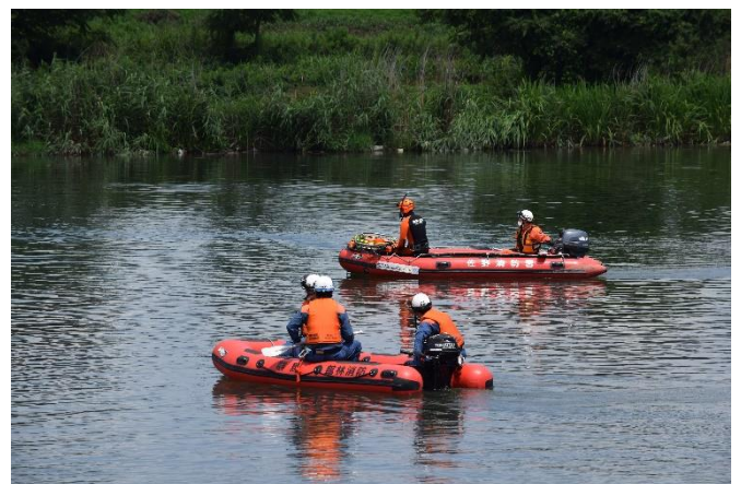
舟艇による搜索活動開始