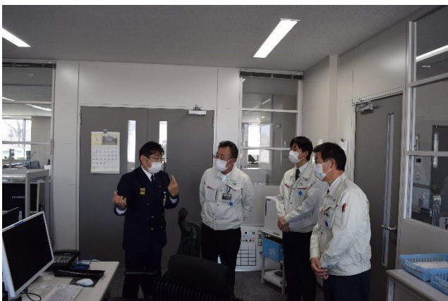
通信指令課の見学の様子