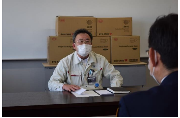
高草木社長からのご挨拶