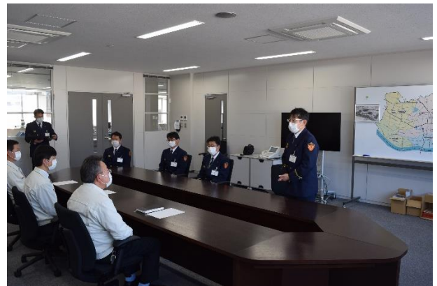
福地消防長からのお礼のあいさつ