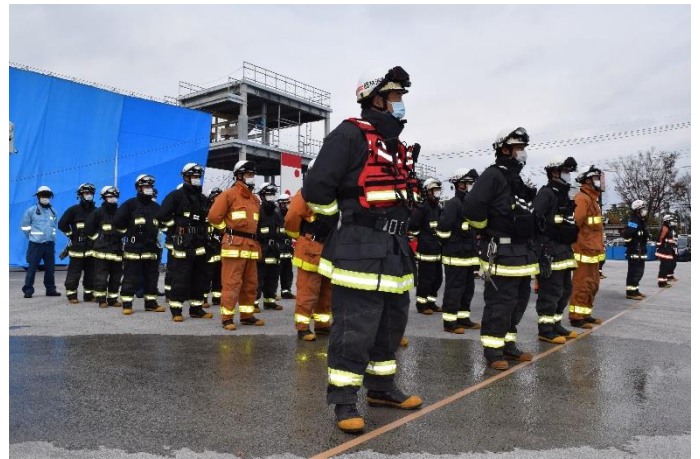
訓練終了報告及び訓練講評