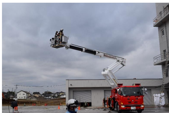
足利市消防本部到着 活動開始