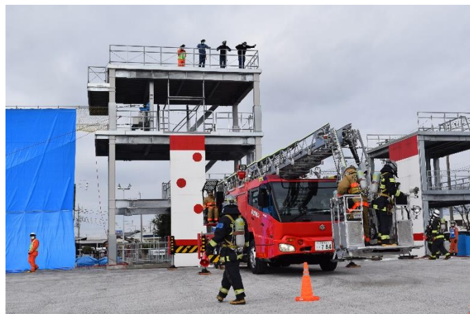
太田市消防本部到着 活動開始