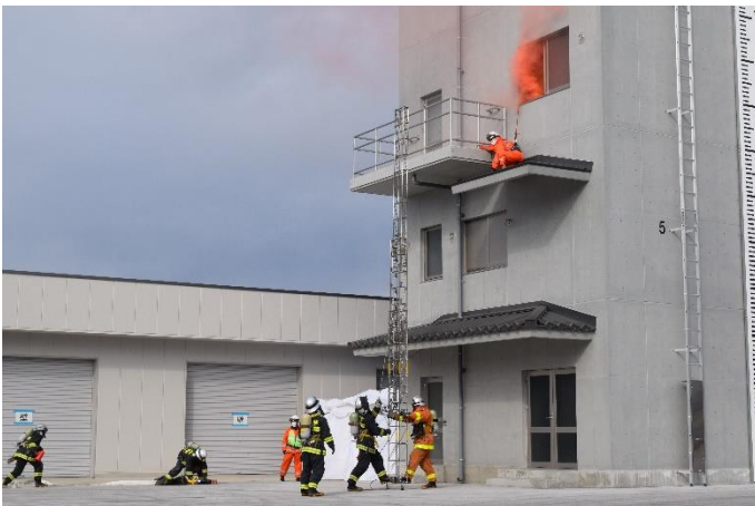
館林地区消防組合活動開始