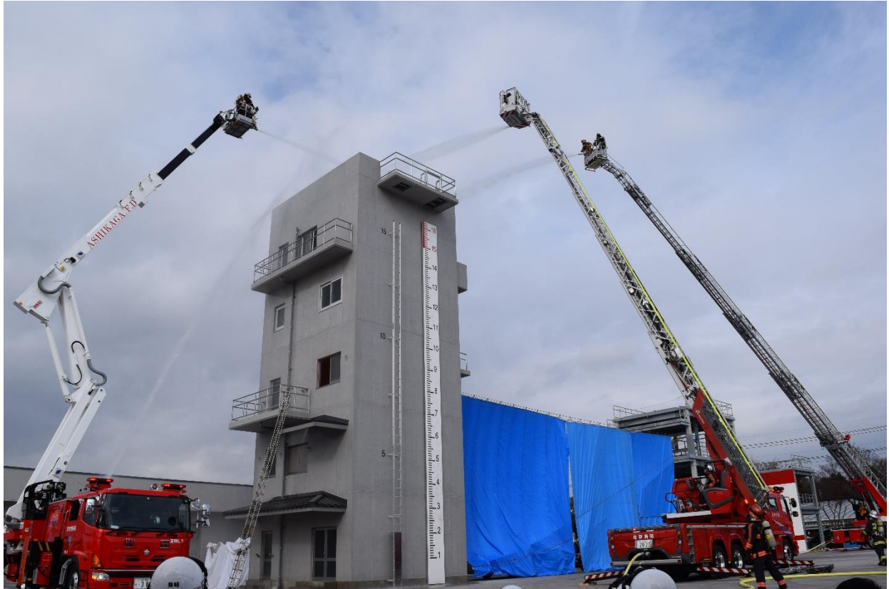
応援隊による一斉放水